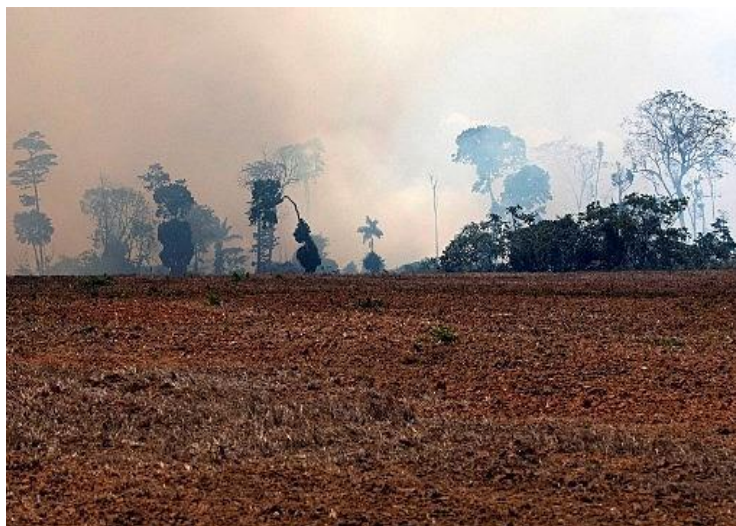
Incêndio na floresta amazônica (Foto João Laet, 2022)

A Educação Ambiental, quando atravessada por essa perspectiva, deixa de ser instrumento de sensibilização comportamental e torna-se prática ética. É preciso sustentar a pergunta pelo desejo e pelo futuro, não como promessa técnica, mas como gesto ético-político e simbólico. A psicanálise lembra-nos que uma sociedade incapaz de nomear seu sofrimento está também impossibilitada de transformá-lo (Farias, 2021; Farias & Gurski, 2024).