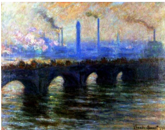
Claude Monet: O Tâmis abaixo de Westminster, 1871

O conceito de Antropoceno emerge justamente para nomear o esgotamento desse regime de estabilidade. Ele aponta para uma mudança profunda na forma como vivemos, habitamos a Terra e nos relacionamos com ela. Ao criarmos um sistema econômico que não apenas organiza a produção, mas se converte em modo de vida, tornamo-nos não apenas habitantes do mundo, mas uma força geológica, capaz de intervir nos sistemas da Terra em escala planetária (Pádua & Saramago, 2023).