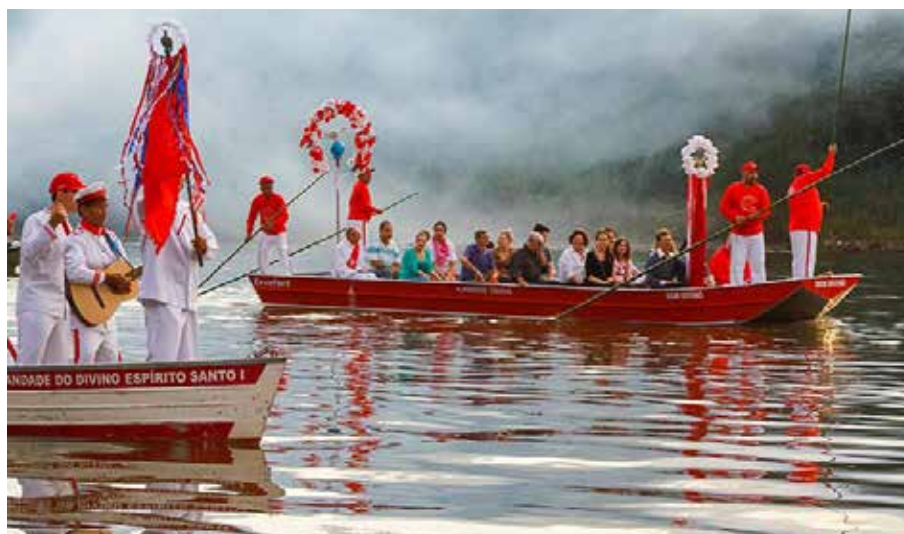
Imagem 1 Festa do Divino no Rio Piracicaba, 2017 Fonte: ZAVARIZE, 2017 40

As modificações oriundas de séculos de festas vão sendo observadas nas cidades. Essas alterações parecem caminhar com as múltiplas relações entre indivíduos e coletividades étnicas, multiplicando as culturas e absorvendo especificidades. Em Piracicaba, as festas são construídas no âmago do símbolo mais relevante da cidade, o rio. 41